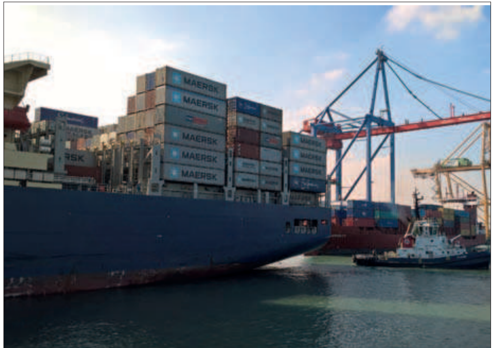
Operativa en el puerto de Valencia

Por países, respecto al tráfico de TEUs EE.UU encabeza las relaciones comerciales con Valenciaport con un movimiento de 384.818 contenedores (-2,94%) seguido de China con 380.940 (-8,6%) y Tur-