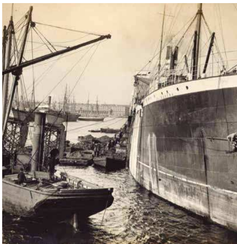
El vapor Valbanera atracado en puerto

El Valbanera emprendió su último viaje con malos precedentes. Su travesía previa, dos meses antes de su hundimiento, en la que trasladó 1.600 personas desde Cuba a España, generó una gran polémica por las condiciones en que se vieron obligados a viajar los pasajeros. El exceso de pasaje obligó a muchas personas, ante la falta de camarotes, a hacinarse en la cubierta, con mala alimentación y soportando las inclemencias del tiempo. La gripe hizo estragos. Se produjeron varios