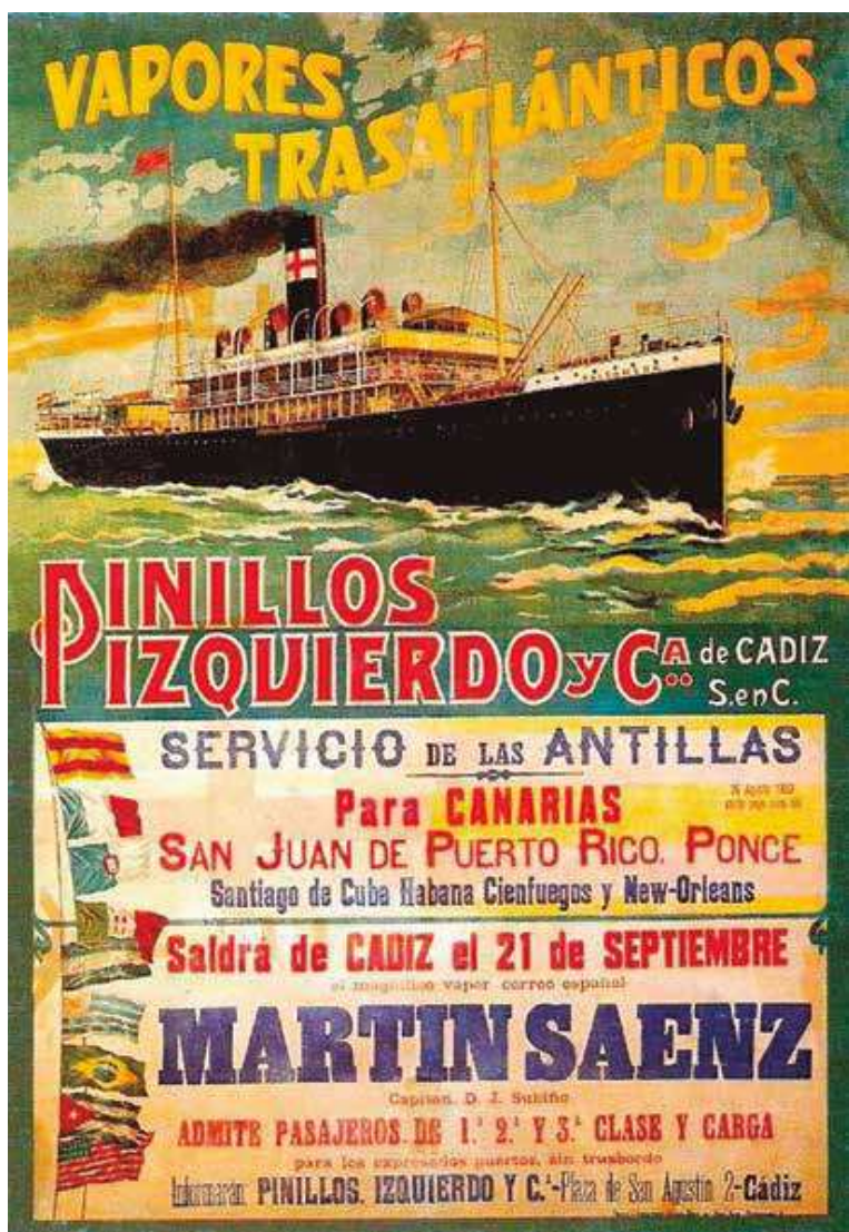
Cartel de uno de los viajes de la Naviera Pinillos Izquierdo a Latinoamérica